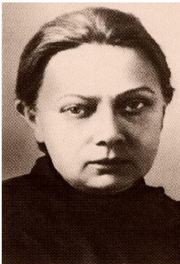
Крупская Надежда Константиновна